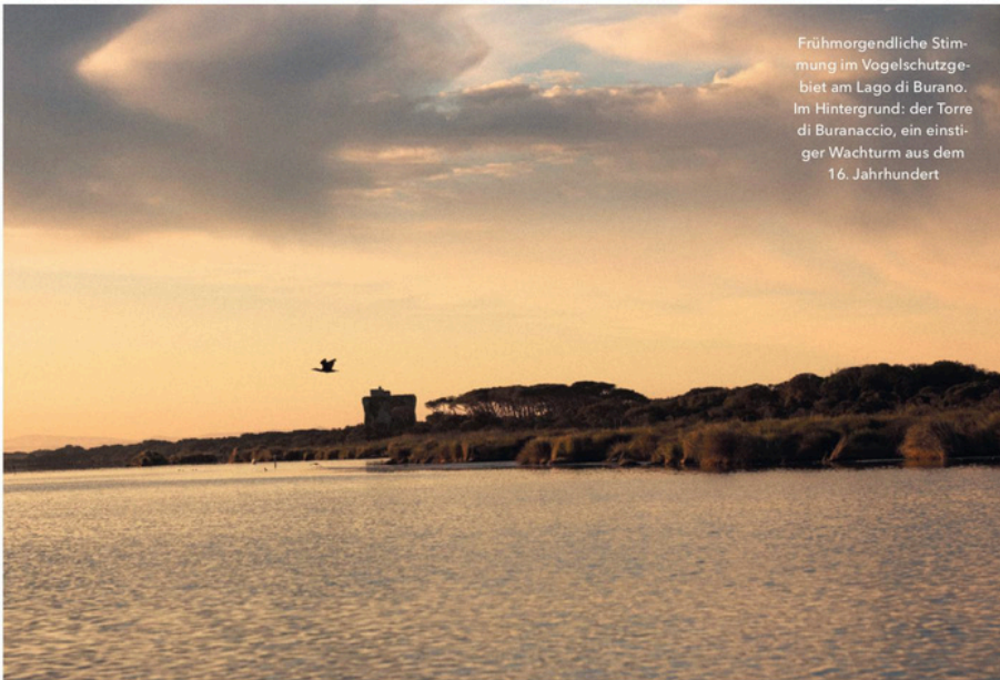
Frühmorgendliche Stimmung im Vogelschutzgebiet am Lago di Burano. Im Hintergrund: der Torre di Buranaccio, ein einstiger Wachturm aus dem 16. Jahrhundert